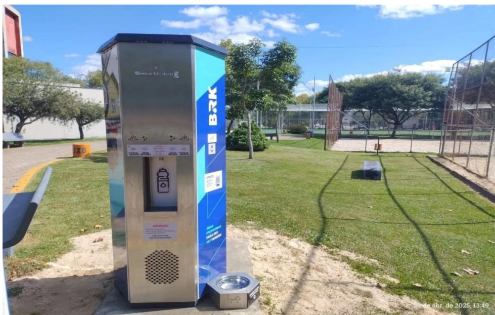
Figura 2 - Cidade de Caçador/SC - https://portalrbv.com.br/cotidiano/saude/instalado-o-primeiro-chimarrodoro-em-cacador/

Rua: Erwino Menegotti, 478 – Água Verde - Jaraguá do Sul - SC 89254-000 - Telefone: (47) 2106-9100 – www.samaejs.com.br