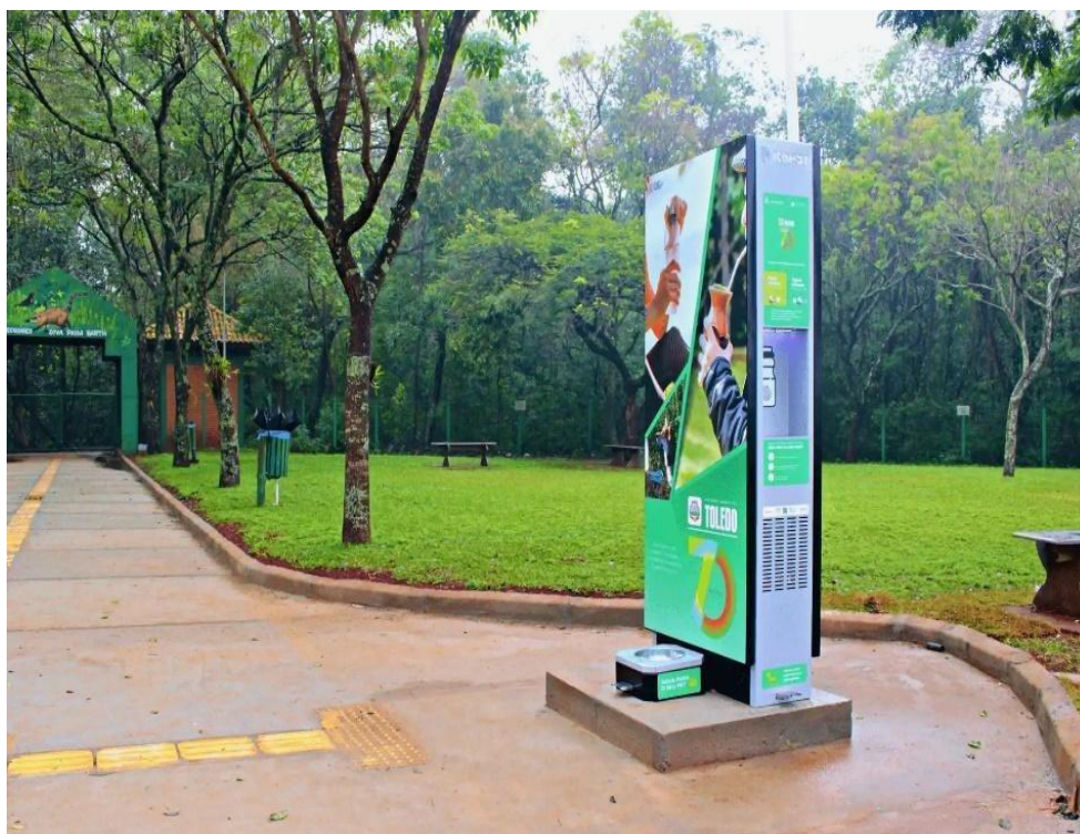
Figura 1 - Cidade de Toledo/PR - https://icehot.net.br/prefeitura-cliente/prefeitura-de-toledo-pr/