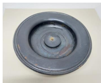
Figura 1 e 2 Diafragma compatíveis com as marcas Bermad, Redutech e RBA